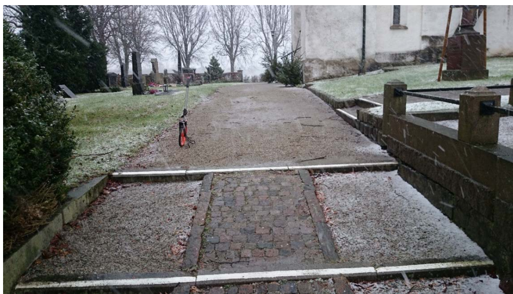
Figur 2. Det aktuella området där tillgänglighetsanpassning skulle utföras.

År 2012: I samband med att Lunds kommun planerar att anlägga dammar och grönområden inom delar av fastigheterna Stora Råby 33:15 och 36:15, Stora Råby socken, Lunds kommun, genomfördes en arkeologisk förundersökning av de delar av Stora Råby bytomt (RAÄ 10:1) som kommer att beröras av arbetsföretaget, ca 11 300 m 2 . Vid undersökningen framkom nedgrävningar, sannolikt lertäkter och diken från historisk tid samt ett mindre antal lämningar daterade till vendel-/vikingatid. Det gjordes en utökad insats gällande metalledetekteringen då det påträffades mynt och andra föremål som sannolikt kan kopplas till Skånska kriget (Lindberg 2013).