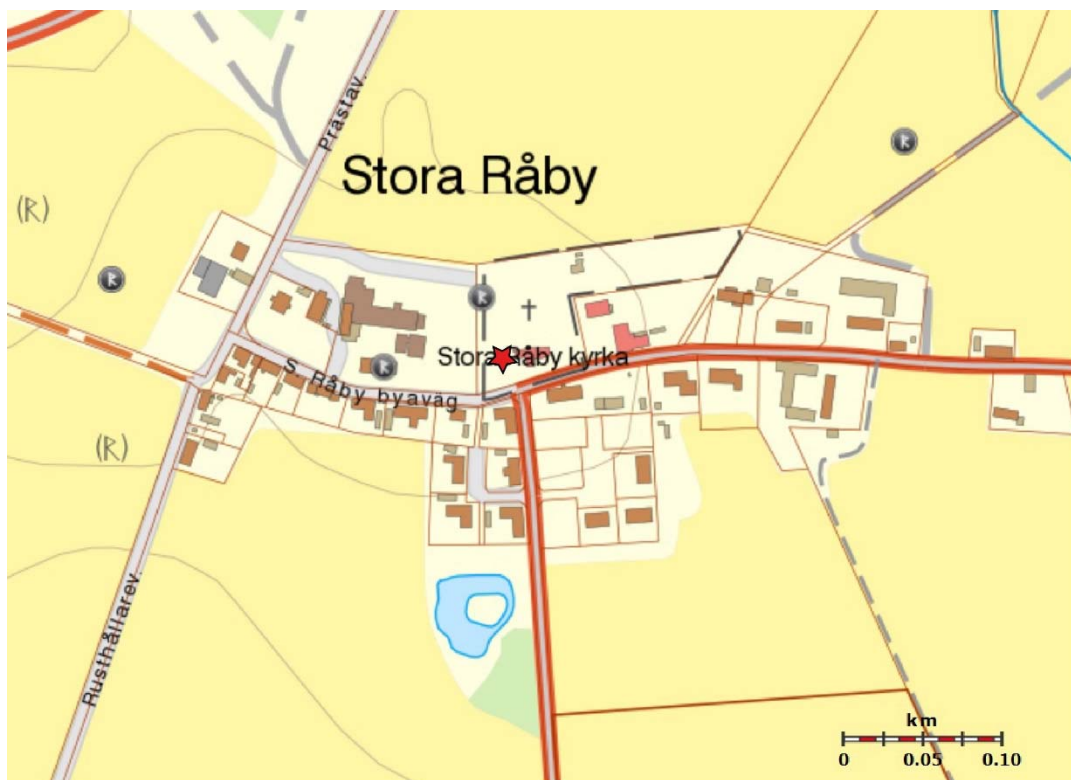
Figur 1. Undersökningsområdets läge i Stora Råby.