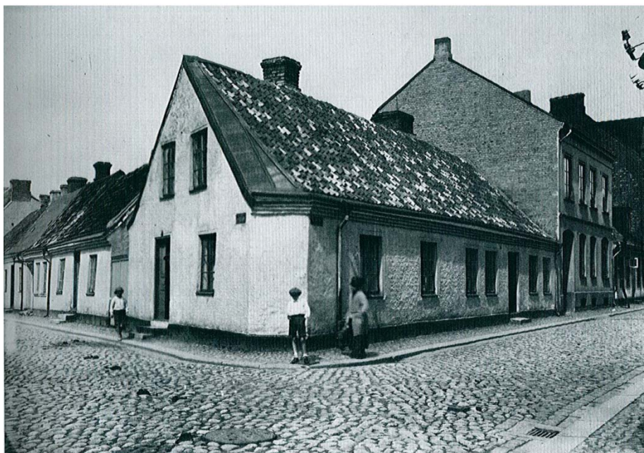
Figur 2. Hörnet av Lilla Tvärgatan och Bankgatan omkring 1900. På bilden syns den gatuhusbebyggelse varifrån sannolikt de raseringsmassor som påträffades i schaktet härrör (Bevaringskommittén 1980 s 85).

daterade till tidig medeltid. Resterande exploateringsyta och kulturlager dokumenterades endast genom antikvarisk kontroll. Den metod som användes vid den antikvariska kontrollen kom att innebära att en grundgrävning genomfördes ned till moränen, därefter dokumenterades endast anläggningar som syntes däri. Dessa anläggningar bestod av ett mycket stort antal gropar, brunnar och rännor varav huvudparten kunde dateras till perioden 1000-1200 (Carelli & Lenntorp 1994 s 15f, Ryding 1986 s 10).